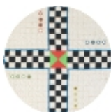
127 silk off white