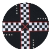
123 cotton black