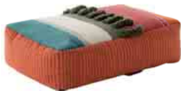
Alexandra 110x72x32h cm / 43"x28"x13" h Colores. Colours.

Composición fibras. Fibre composition: 100% lana virgen. 100% new wool. Relleno. Filling: 100% poliestireno. Polystyrene. Peso. Weight: 12,9 Kg. / 28 lbs. Volumen. Volume: 0,44 m 3 / 16 ft 3 .