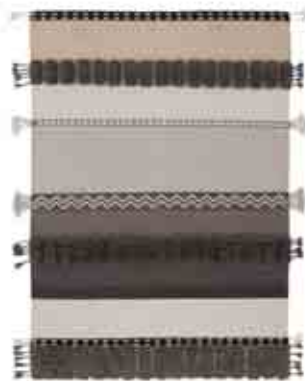
Alexandra 170x240 cm / 5'7"x7'11" 200x300 cm / 6'8"x9'10" Neutra. Neutral.