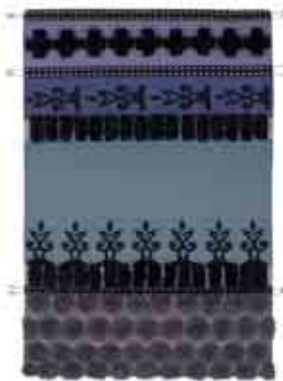
Tumbuctú 170x240 cm / 5'7"x7'11" 200x300 cm / 6'8"x9'10" Colores. Colours.