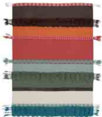
Alexandra 170x240 cm / 5'7"x7'11" 200x300 cm / 6'8"x9'10" Colores. Colours.

Composición fibras. Fibre composition: 100% lana virgen. 100% new wool. Peso total aprox. Total weight approx.: 2 kg/m 2 . Altura total aprox. Total height approx.: 20 mm. Técnica de fabricación. Manufacturing technique: GLAOUI.