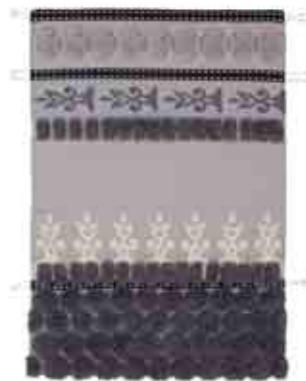
Tumbuctú 170x240 cm / 5'7"x7'11" 200x300 cm / 6'8"x9'10" Neutra. Neutral.