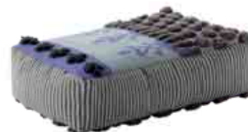
Tumbuctú 110x72x32h cm / 43"x28"x13" h Colores. Colours.