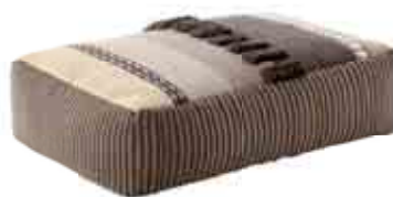
Alexandra 110x72x32h cm / 43"x28"x13" h Neutra. Neutral.