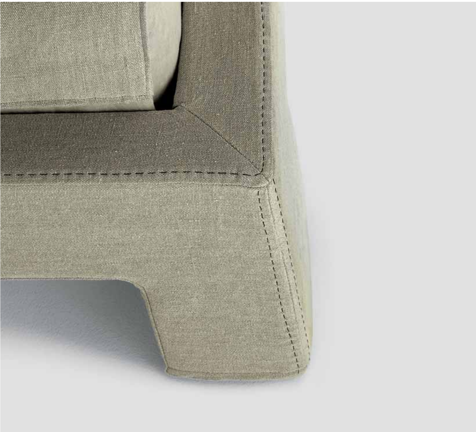
versione B: con punto imbastitura