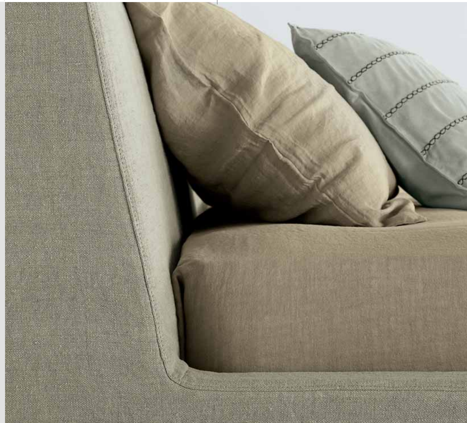
versione A: senza punto imbastitura