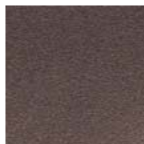
Rame ossidato Oxidized copper Oxidiertem Kupfer Cuivre oxydé