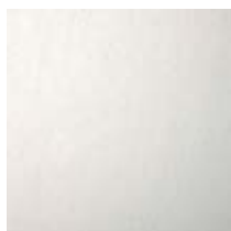
Alluminio Aluminium Aluminium Aluminium